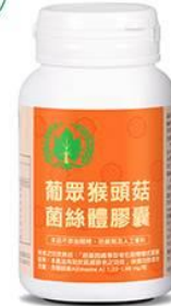
猴頭菇菌絲體 (ヤマブシタケ菌系体)

☑ 神経保護のヤマブシタケを使用。アルツハイマー型認知症や高齡による聴力低下などを改善する効果あり。