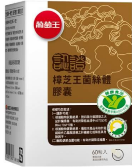
樟芝菌絲體 (ベニクスノキタケ菌系体)