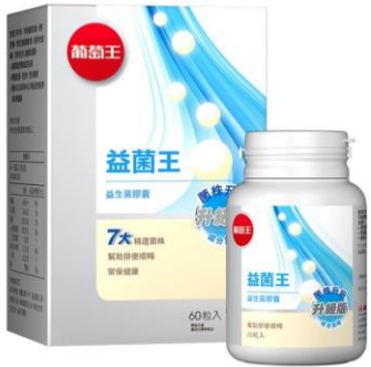
益菌王 (プロバイオティクス)