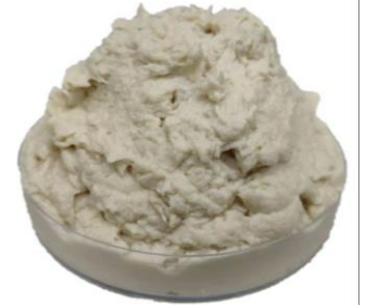
真菌蛋白 (マイコプロテイン)

☑ 神経保護のヤマブシタケを使用。アルツハイマー型認知症や高齡による聴力低下などを改善する効果あり。