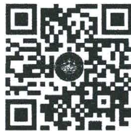
QR Code เข้าร่วมงานผังเมืองโลก ผ่านทาง YouTube

สอบถามรายละเอียดเพิ่มเติมได้ที่เจ้าหน้าที่สถาบันฯ ☎ โทรศัพท์หมายเลข ๐ ๒๒๙๙ ๔๖๑๙ - ๒๐ หรือ