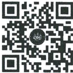
QR Code เข้าร่วมงานผังเมืองโลก ผ่านทาง Facebook