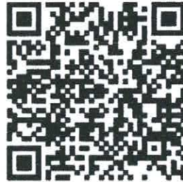
QR Code ลงทะเบียน