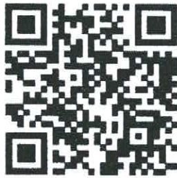
QR Code รายละเอียดโครงการ