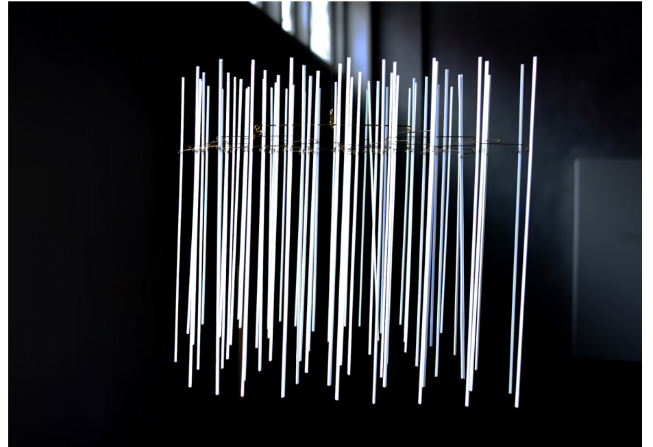
za-za- 7 Object, 2023 Brass, paper, nylon thread