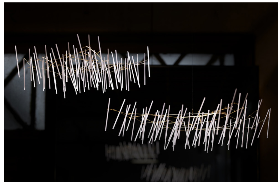
za-za- 1 Object, 2023 Brass, paper, nylon thread