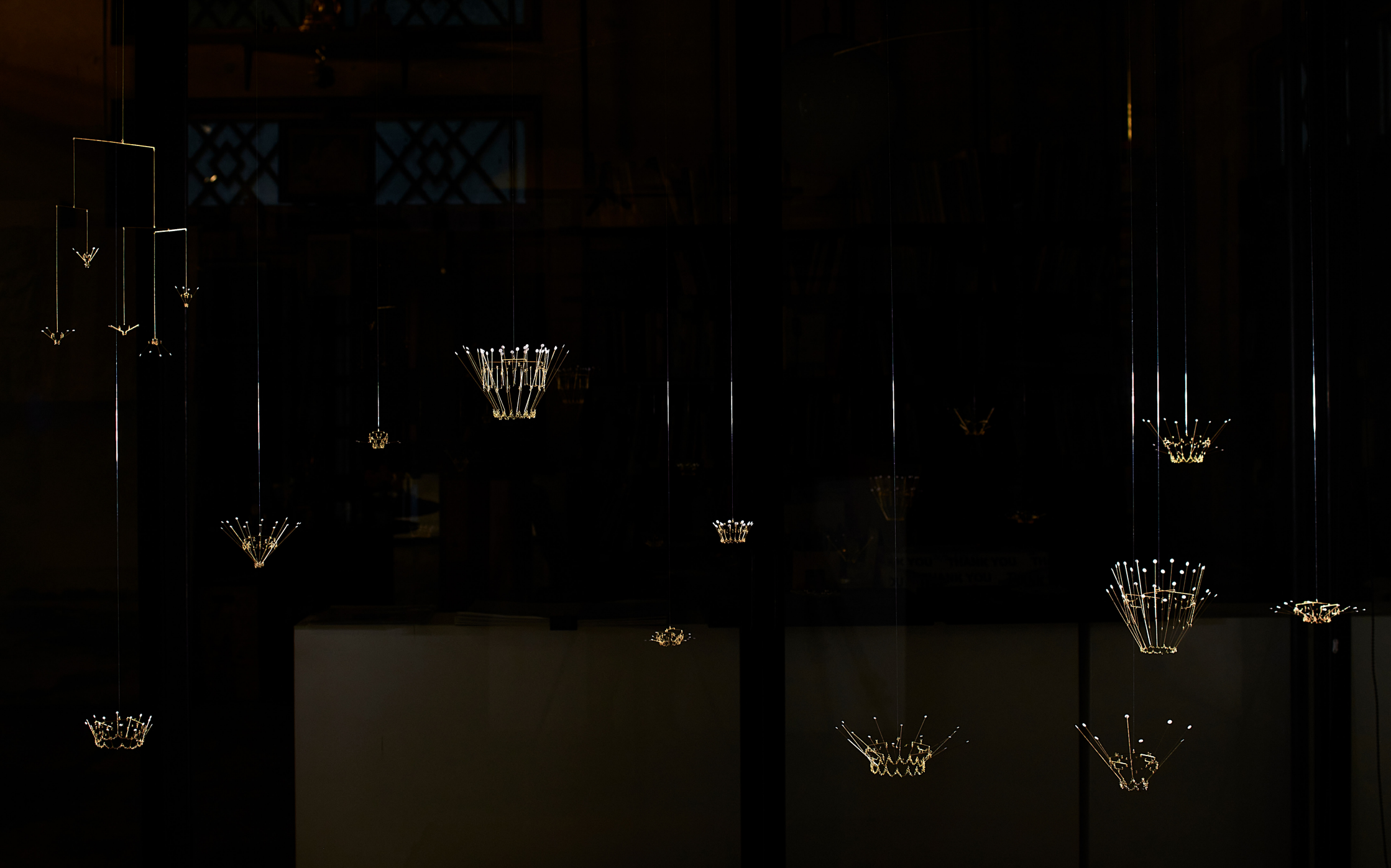
Shito Shito Flower Studies 1 Object, 2023 Brass, paper, nylon thread