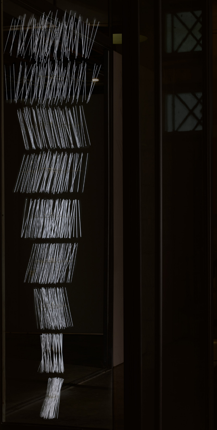
za-za- y Object, 2023 Brass, paper, nylon thread