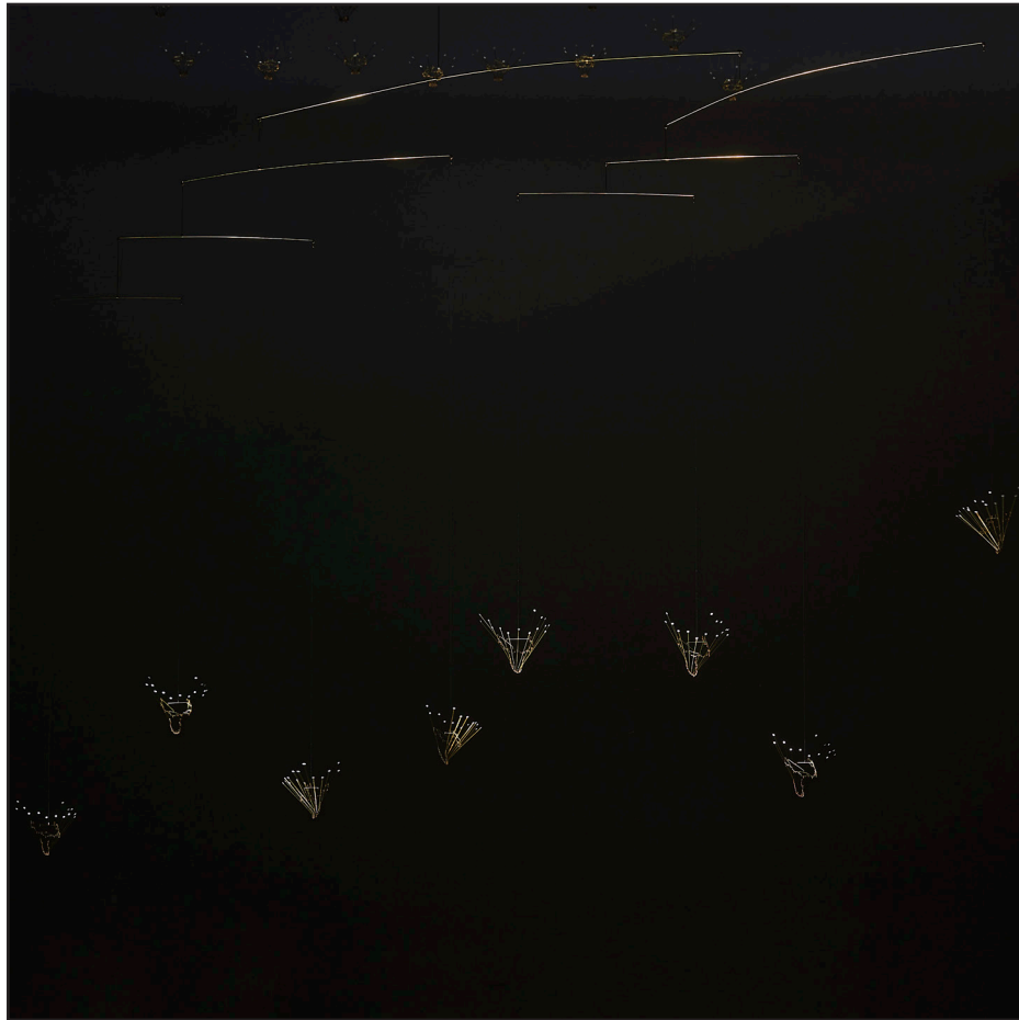
shito shito flower 5 Object, 2023 Brass, paper, nylon thread