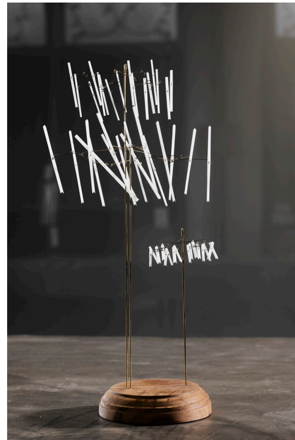
Untitled 1 Object, 2023 Brass, paper thread, teak wood