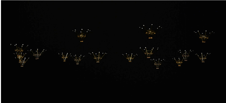
shito shito flower 3 Object, 2023 Brass, paper, nylon thread