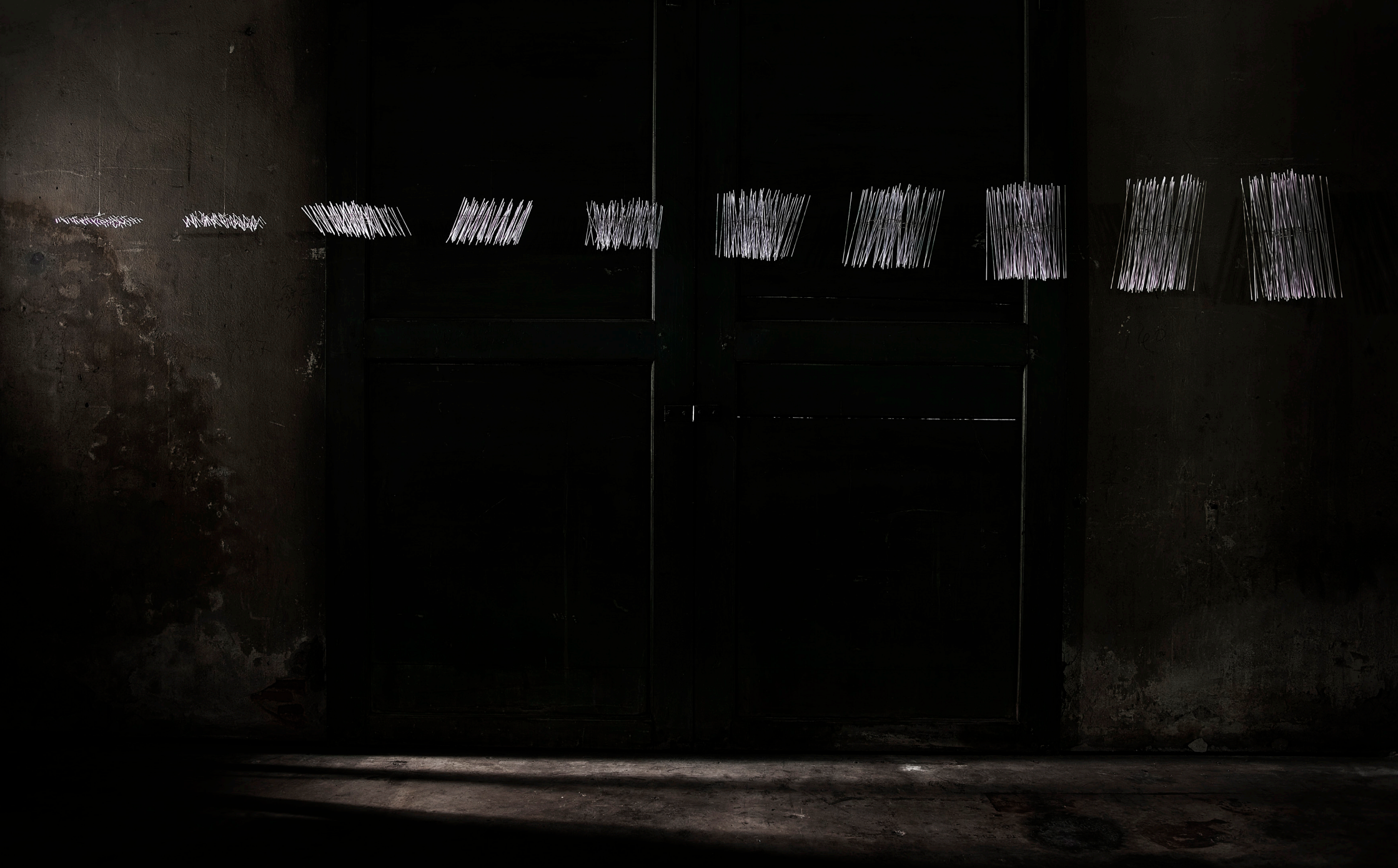
za-za-x Object, 2023 Brass, paper, nylon thread