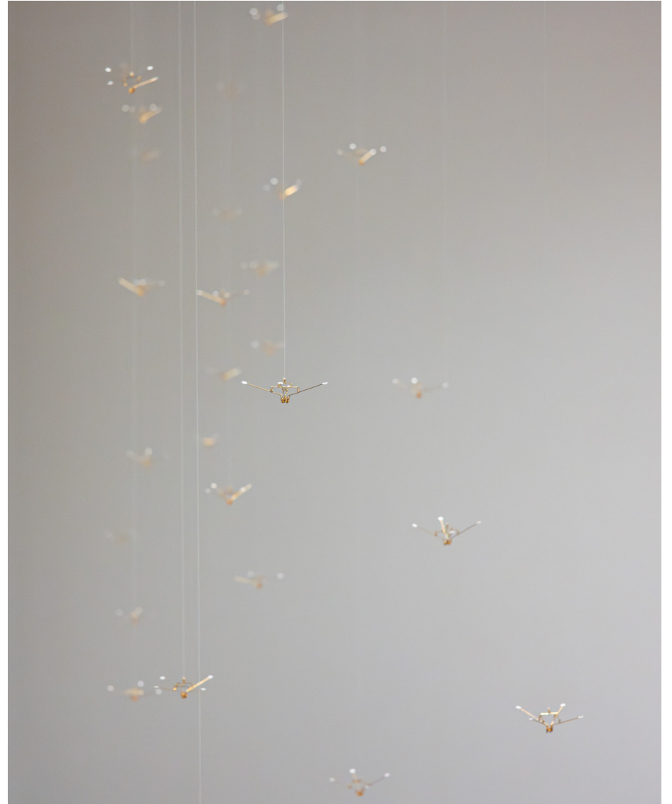
shito shito flower 2 Object, 2023 Brass, paper, nylon thread