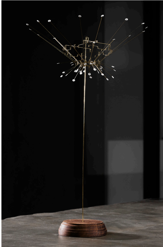
Untitled 6 Object, 2023 Brass, paper thread, teak wood