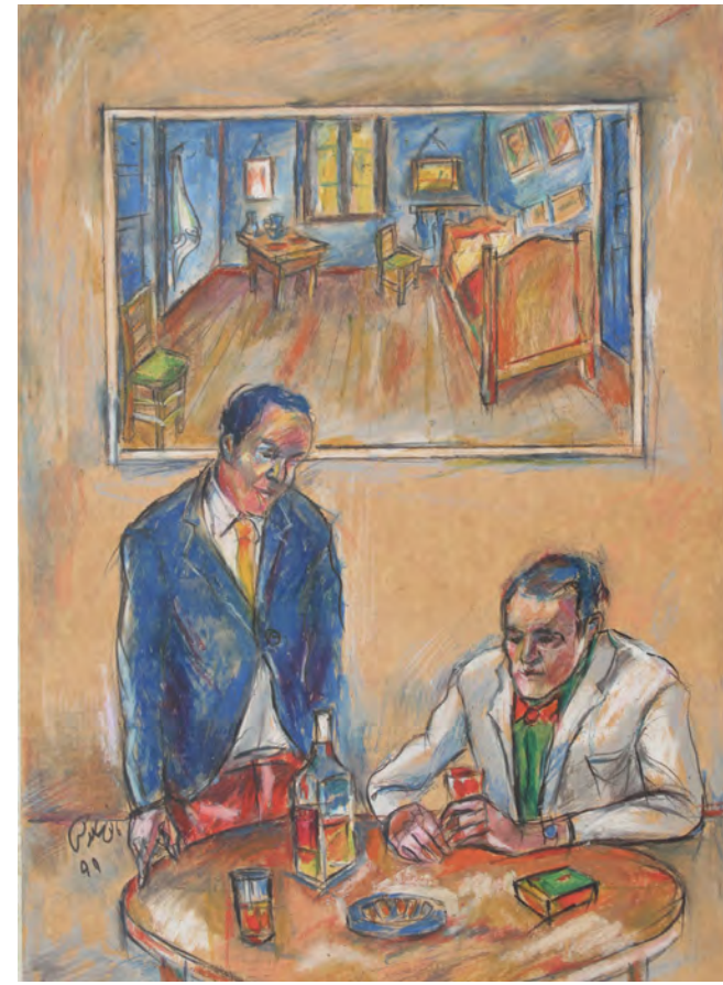
25×35 cm ۲۵×۳۵ cm پاستل روغنی روی مقوا Oil pastel on cardboard

تلفیقی از کازابلانکا و ون گوگ. سعی کردم با رنگ لباس‌ها بین آن‌ها ربطی ایجاد کنم. همفری بوگارت وقتی به مشکلی برمی‌خورد، پینایست سیاه پوستش خیلی نگرانش می‌شد. او در اینجا پیانو زدن را رها کرد ... و هر موقع این کار را می‌کرد به او می‌گفت: Play it again Sam