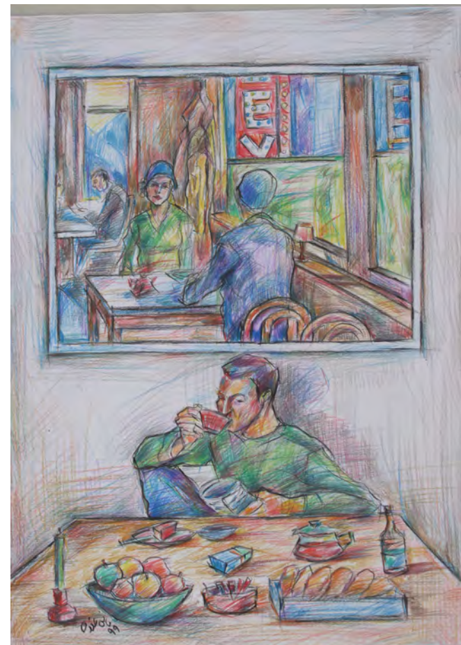
25×35 cm ۲۵×۳۵ cm مداد رنگی روی مقوا Color pencil on cardboard