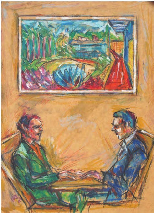
در این کار، از سکانس کافه‌ی فیلم مخصوصه استفاده کردم. اولین بار بود که این دو غول بازیگری مقابل هم قرار گرفته بودند.