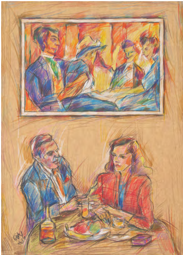
25×35 cm ۲۵×۳۵ cm مداد رنگی روی مقوا Color pencil on cardboard