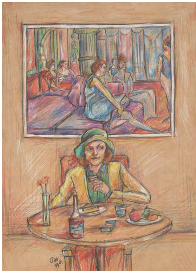
25×35 cm ۲۵×۳۵ cm مداد رنگی روی مقوا Color pencil on cardboard