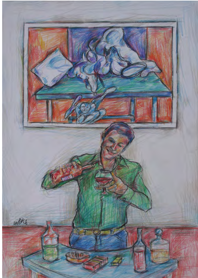
جیمز استوارت، بازیگر کلاسیک مورد علاقه‌ام، در یکی از فیلم‌های غیروسترنش باکاری از فرانسیس بیکن.