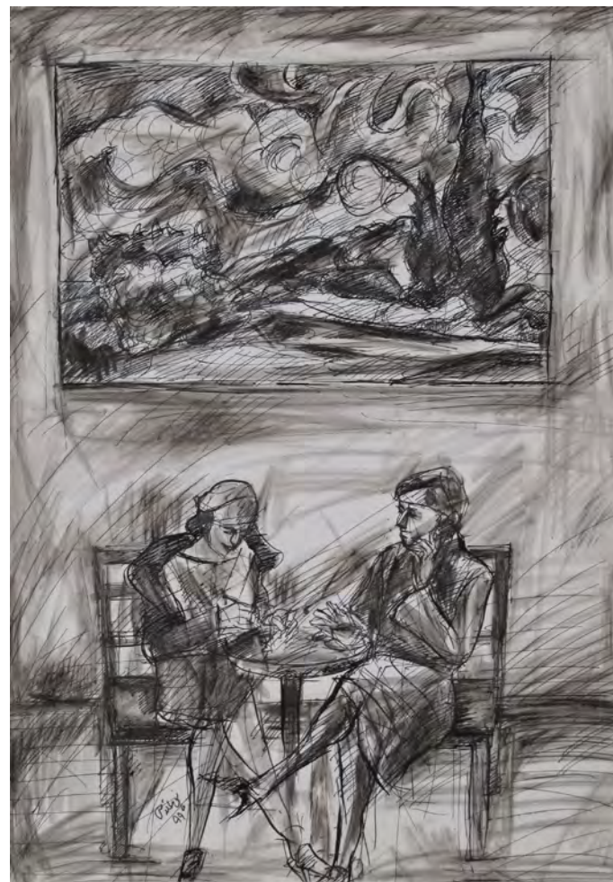
29.7×42 cm ۴۲×۲۹,۷cm جوهر و قلم فلزی روی مقوا Pen and ink on cardboard