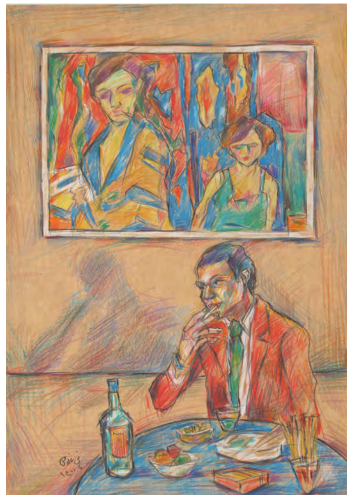
استیو مک کوپین، همیشه دلم می‌خواست مثل او بور باشم با کاری از امیل نوله.