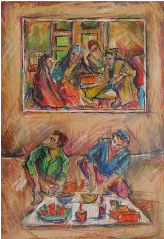
35x50 cm ۵۰x۳۵ cm مداد رنگی روی مقوا Color pencil on cardboard

نقاشی پشت، اثر کمال‌الملک است. سعی کردم با رنگ‌ها در کل اثر و آدم‌های نشسته روی زمین ارتباط برقرار کنم... بچه که بودم، برادرهای بزرگم وقتی دور سفره بودند و غذا می‌خوردیم، حالتشان مانند این فیلم بود.