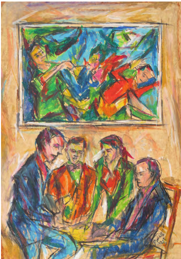
25×35 cm ۲۵×۳۵ cm پاستل روغنی روی مقوا Oil pastel on cardboard

دوست داشتم مانند خود اکسپرسیونیست ها کار کنم، صحنه فیلم و نقاشی به هم نزدیک شد.