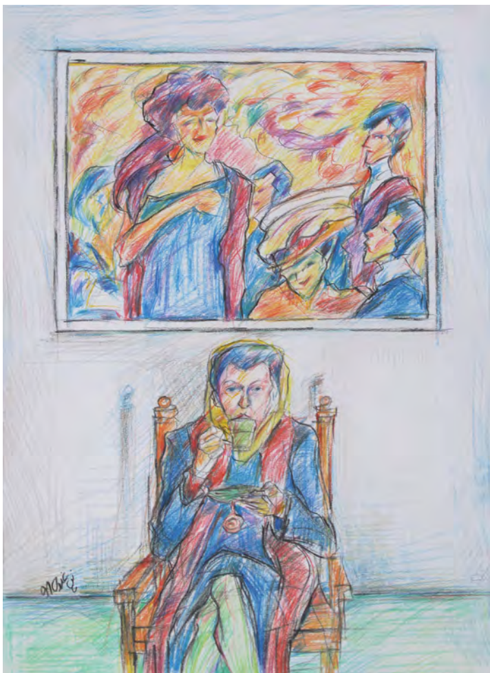
25×35 cm ۲۵×۳۵ cm مداد رنگی روی مقوا Color pencil on cardboard