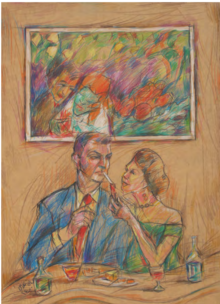
25×35 cm ۲۵×۳۵ cm مداد رنگی روی مقوا Color pencil on cardboard