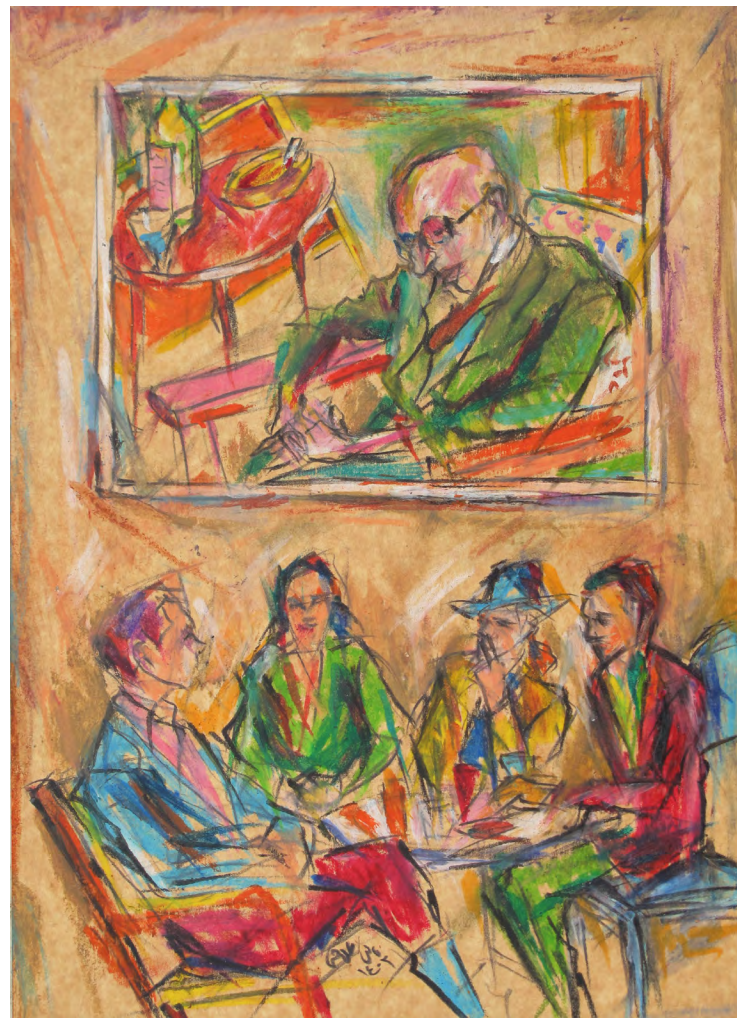
25×35 cm ۲۵×۳۵ cm پاستل روغنی روی مقوا Oil pastel on cardboard