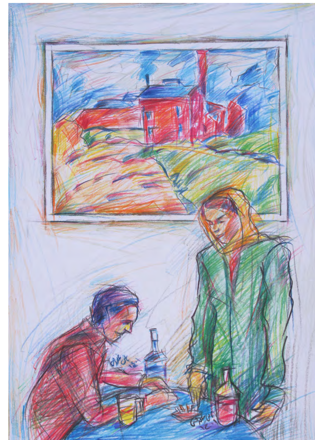
همفتری بوگارت در کارابانکا هر موقع گرفتار پلیس می‌شد در این حالت بود. اینجا هم با عشق قبلی اینگرید برگمن و منظره‌ای از امیل نولد تصویر شده است.