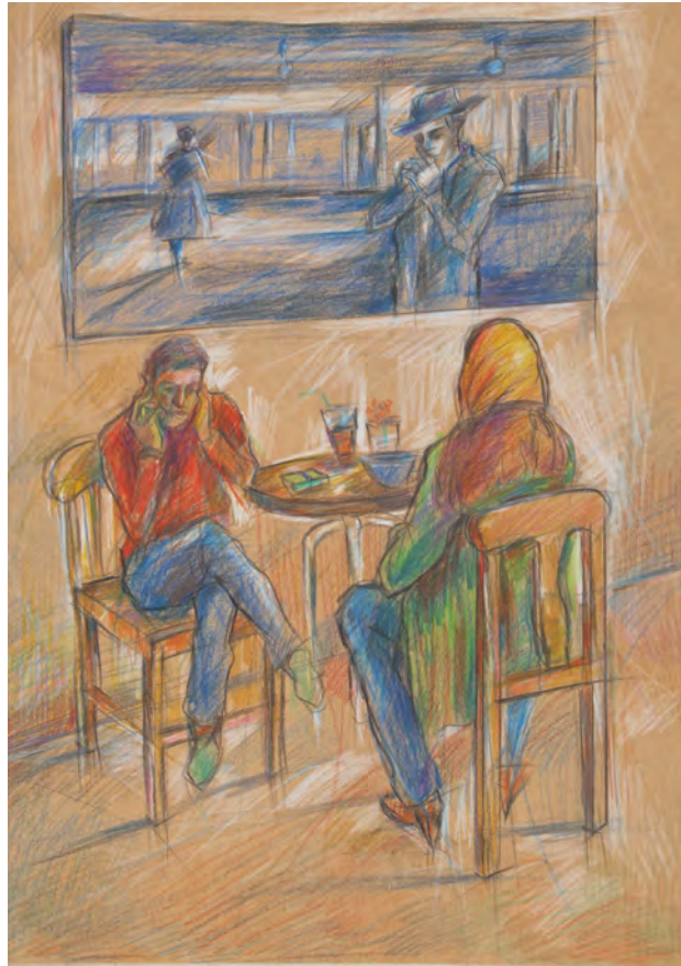
25×35 cm ۲۵×۳۵ cm مداد رنگی روی مقوا Color pencil on cardboard

کافه کلاسیک با این اثر آغاز شد. از کافه آرته که در خیابان فرشته بود و نوارهایم مدتی روی دیوارهایش بود، عکس گرفتم و کار کردم.