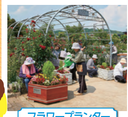
フラワープランター