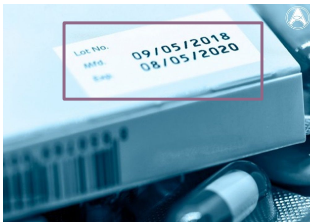
Imagem 1: Prazo de validade de um medicamento.

Os medicamentos que já não são usados ou que ultrapassaram o prazo de validade, devem ser entregues na Farmácia para uma eliminação adequada. O descarte de medicamentos no lixo doméstico ou no esgoto constitui um risco para a saúde pública.