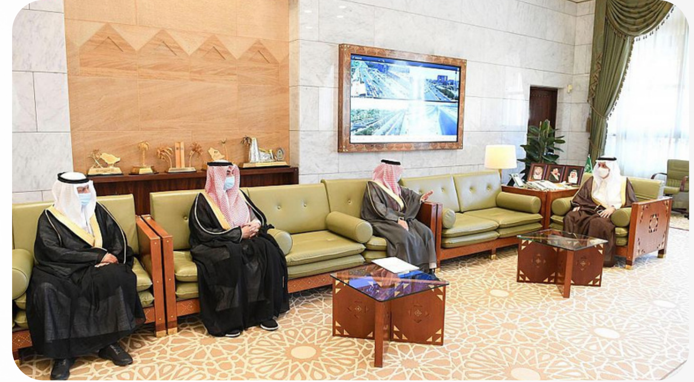
سمو أمير منطقة الرياض الأمير فيصل بن بندر بن عبدالعزيز استقبل مسؤولي الجمعية وفريق عمل مبادرة كفاءة للمساجد