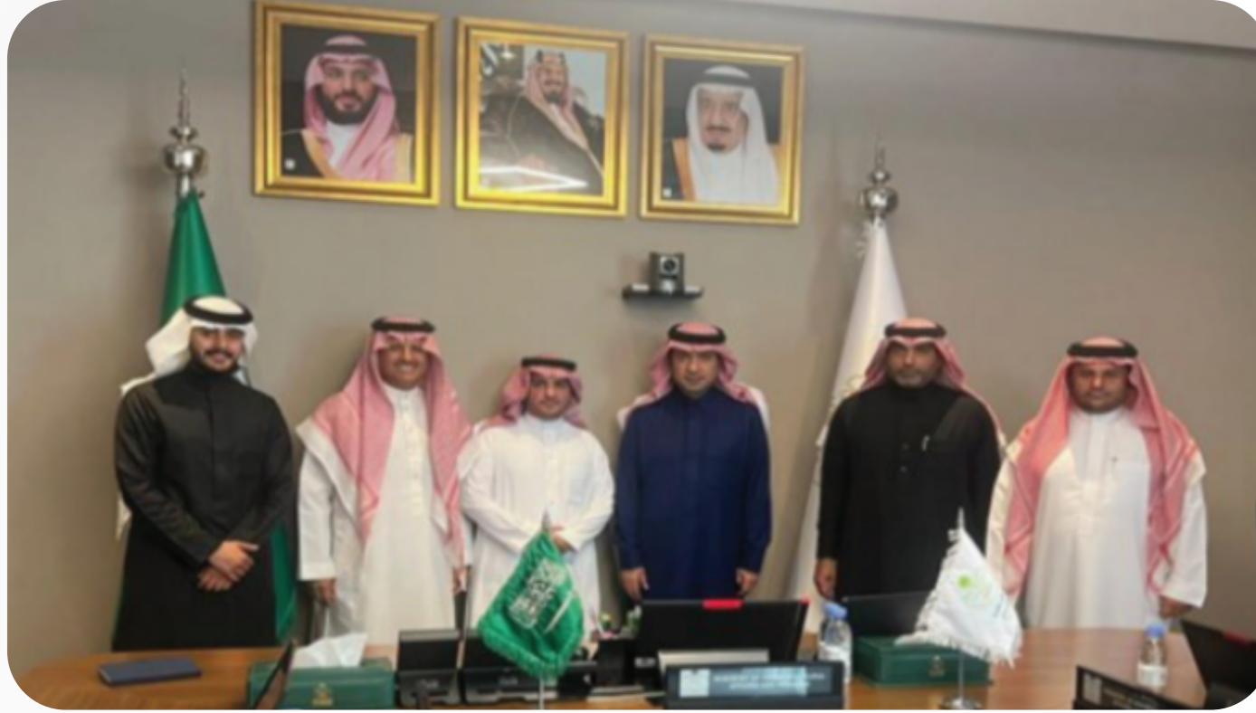
معالي وزير الشؤون البلدية والقروية والإسكان الأستاذ ماجد الحقييل خلال استقباله مسؤولي الجمعية وفريق عمل مبادرة كفاءة للمساجد