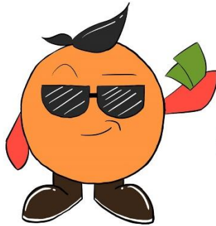
ชื่อตัวละคร 2