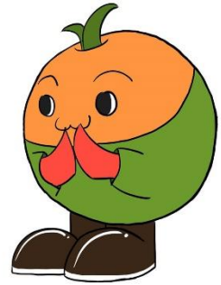
ชื่อตัวละคร 4