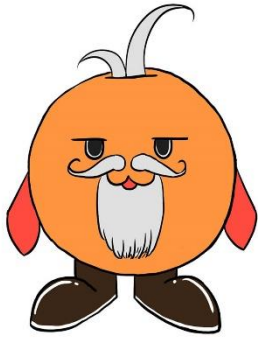
ชื่อตัวละคร 1