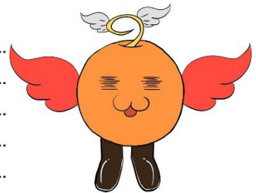
ชื่อตัวละคร 5