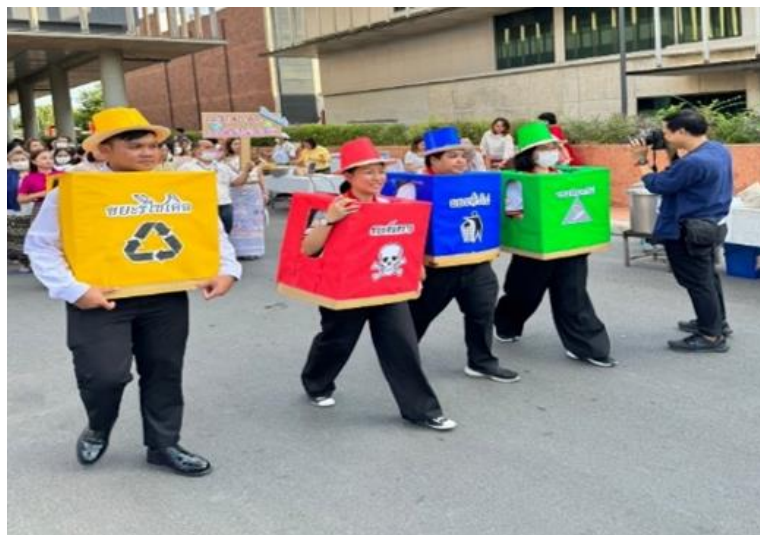
ภาพกิจกรรมการเดินรณรงค์และการประกวดขบวนคุณธรรม