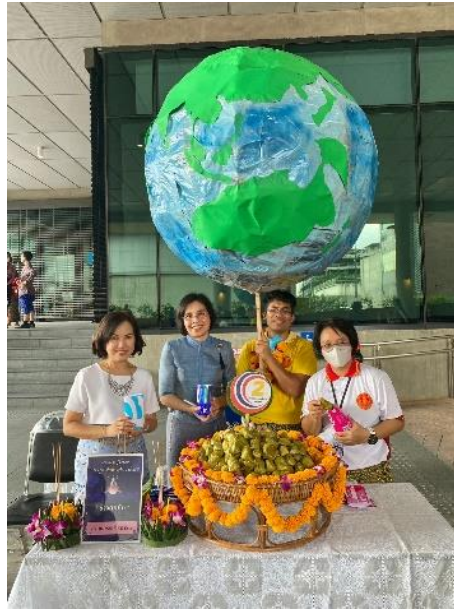
ภาพซุ้มอาหารของสำนักกรรมการ ๒