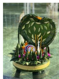
กระทงที่ประดิษฐ์เสร็จแล้ว

บุคลากรสำนักการรวมาธิการ ๒ ได้ร่วมกันในการจัดทำกระทงและขบวน โดยได้มีการนัดหมายและร่วมกันจัดกระทงและรถขบวนให้สำเร็จ ก่อนวันงาน