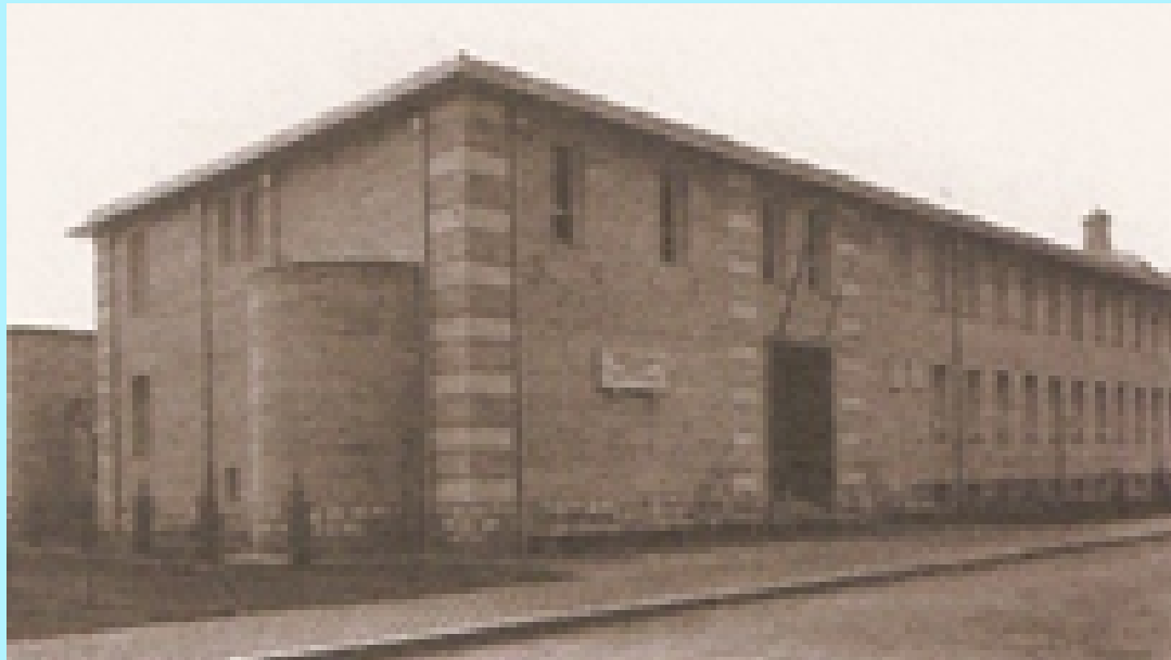
Kontserbatorioaren fatxada ca. 1963, plaka prestatuta, baina bustorik gabe. Jatorri ezezaguna

Sarasateren bustoa inauguratu berria zen eta bibolin-jole iruindarraren izena hartu zuen Musika Kontserbatorioko eraikineran eraman zuten fatxada apaintzeko, Agoiz kalean.