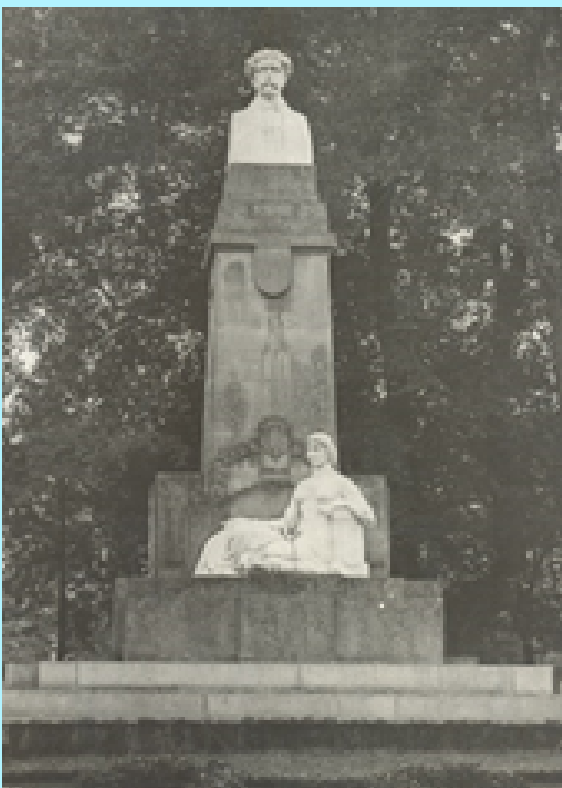
Pablo Sarasateren monumentua 1933an

Multzoak elementu sinbolikoak aurkezten ditu, hala nola, Iruñea irudikatzen duen matrona bat, hiriko armaharriaren gainean makurtuta, dantzaren eta erritmoaren alegoriak, biolinak eta Sarasateren beraren partitura zatiak. Orduko prentsaren arabera, kostua 21.800 pezetakoa zen. Lehenengo harria 1918ko uztailaren 6an jarri zen solemneki eta urte bereko irailaren 22an egin zen inaugurazioa.