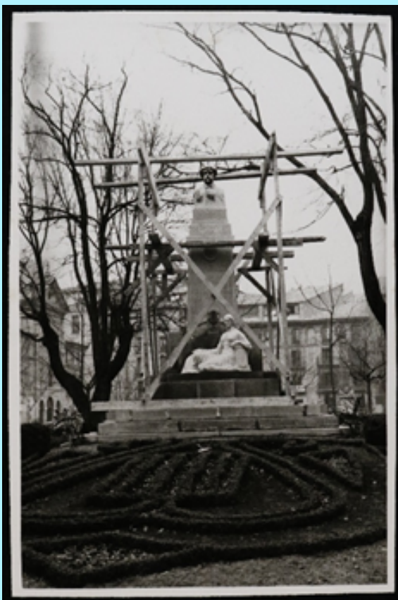
Pablo Sarasateren monumentua 1964an aldamiokin prestatua desmontatzeko.

1964an bustoa Hilarión Eslava konpositore burlatarraren beste busto batek ordezkatu zuen, baina gainontzeko multzoa mantendu zen. Bitxikeria gisa, Pablo Sarasateren jatorrizko partiturak gorde ziren berari eskainitako ikur guztiekin batera.