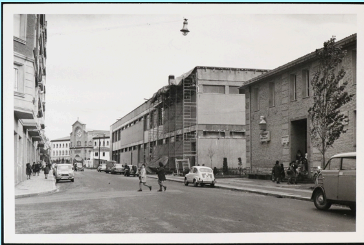
Pablo Sarasate Kontserbatorioko fatxada 1965ean, bibolin-jolearen bustoarekin. Egile ezezaguna. Iruñeko Udal Artxiboa (Arazuri Bilduma) U0020221

La Hormiga de oro (1918/10/5) BNE-Hemeroteka Digitala